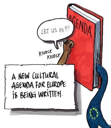
OBRAZEK: Chmurka: Wpuście nas!!!; Dźwięk: Puk puk; Prostokąt: Piszemy nowy plan kulturalny dla Europy.

Elementem polityki kulturalnej instytucji UE powinno być nie tylko zajęcie się przeszkodami, których doświadczają widzowie z niepełnosprawnością, ale też czynna praca nad zwiększaniem liczby widzów z niepełnosprawnością uczestniczących w europejskiej kulturze.